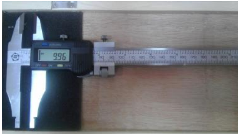
Рисунок 5. Общий вид штангенциркулей типа ШЦЦ-II.