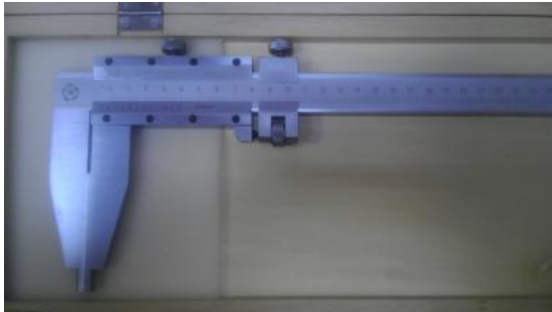
Рисунок 6. Общий вид штангенциркулей типа ШЦ-III.