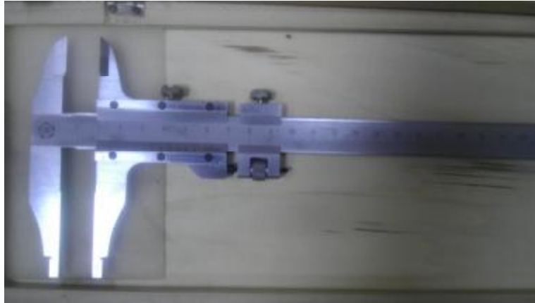
Рисунок 4 - Общий вид штангенциркулей типа ШЦ-II.