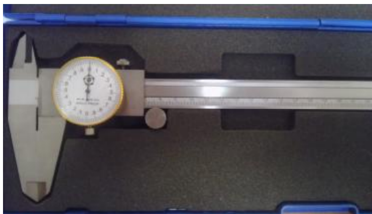
Рисунок 2 - Общий вид штангенциркулей типа ШЦК-I.